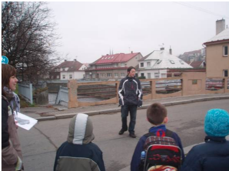
Ze hry po městě